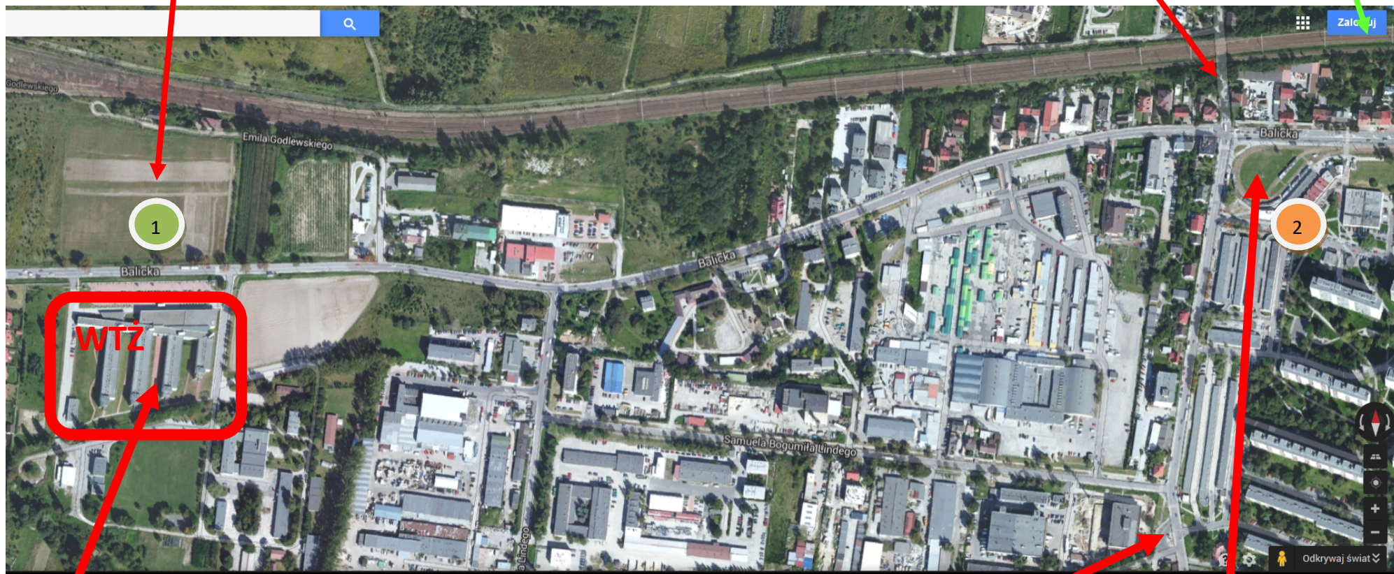
Budynek WTŻ UR

przystanek „Bronowice Małe” dla 218, 226